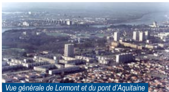
Vue générale de Lormont et du pont d'Aquitaine

Par sa situation géographique, entre fleuve et coteaux, Lormont fut d'abord un site défensif, un port puis un lieu de résidence et de villégiature. Aujourd'hui, Lormont compte près de 22 000 habitants. Sa superficie avoisine les 735 ha. Chef lieu de canton, Lormont est la 10 e commune de la Gironde. Représentative des