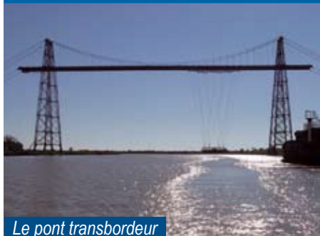
Le pont transbordeur

Rochefort, Ville d'Art et d'Histoire, station thermale, port de plaisance et de commerce, a son Conseil des Sages, mis en place par Monsieur le Maire, en mars 2003 après un appel par lettres personnalisées aux électeurs de plus de 65 ans.