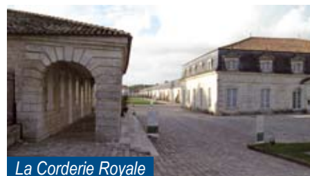
La Corderie Royale

annuelle tenue en Septembre 2006, la question du Maire a porté sur les transports urbains, tandis que celle des Sages s'énonçait « Rochefort, Ville propre et accueillante ». L'Etude sur les transports urbains a fait l'objet d'un partenariat très original avec le lycée de Rochefort, alors que les Sages s'associaient étroitement aux actions qu'ils avaient initiées contre les pollutions et pour la prise en charge du handicap (Animation du Point Handicap).