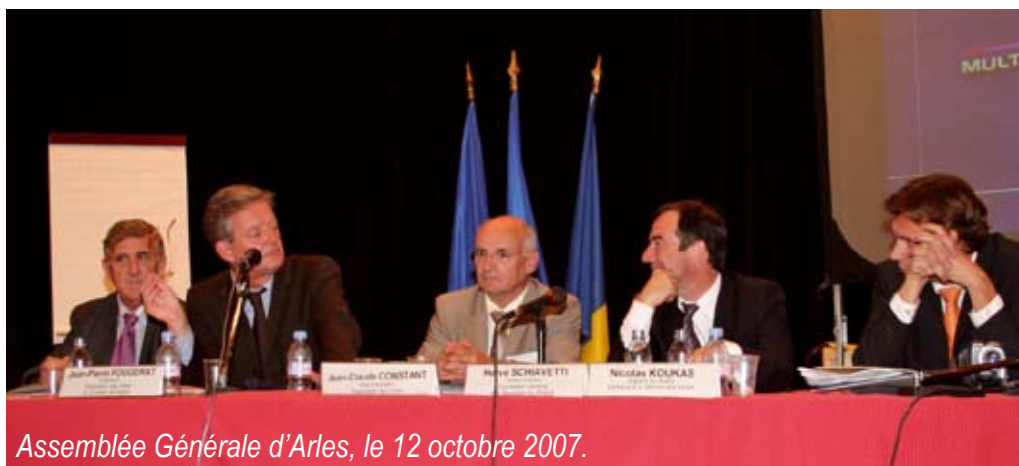
Assemblée Générale d'Arles, le 12 octobre 2007.

A noter enfin l'augmentation significative des adhésions en 2007. Une progression qui devrait aller en s'amplifiant au cours de cette nouvelle année marquée par le scrutin municipal, temps fort de la démocratie représentative et de la démocratie locale auxquelles nous sommes tant attachés ! C'est donc une grande et belle année qui s'annonce et pour laquelle nous souhaitons à la Fédération et à chacun d'entre vous nos vœux les plus chaleureux et les plus sincères !