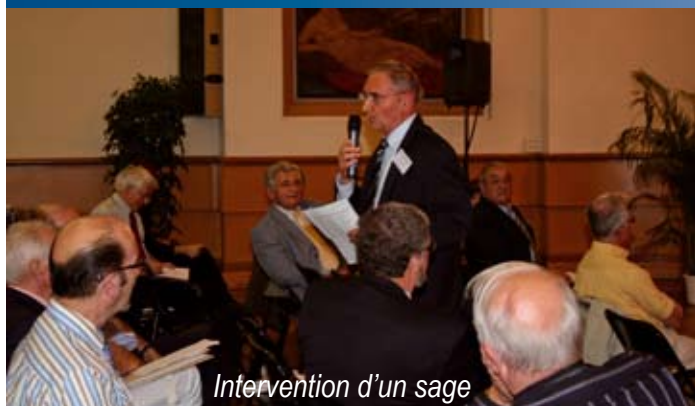
Intervention d'un sage

L'après-midi fut réservée à l'intervention de différentes communes. Le Conseil des Aînés d'Arles a présenté son fonctionnement : 9 commissions dont 2 sur le patrimoine. Une commission communication et animation (communication auprès des commerçants et des personnes âgées et animation et loisirs), aménagement urbain et développement (repopulation du centre-ville, dynamisation du commerce