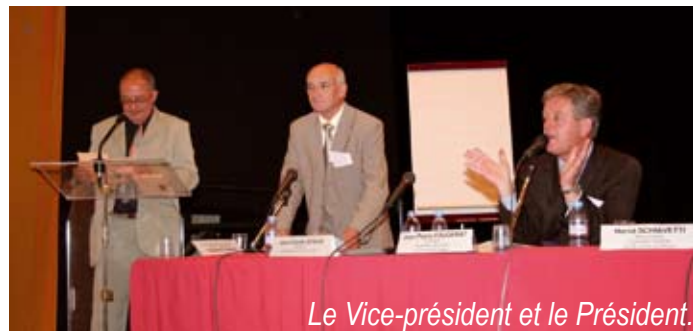
Le Vice-président et le Président.