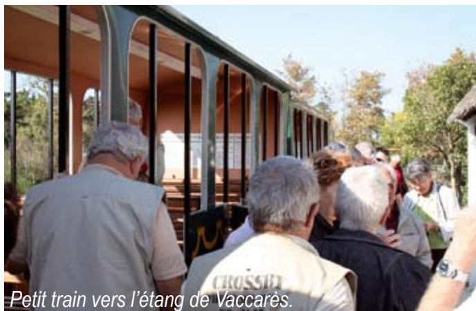
Petit train vers l'étang de Vaccarès.