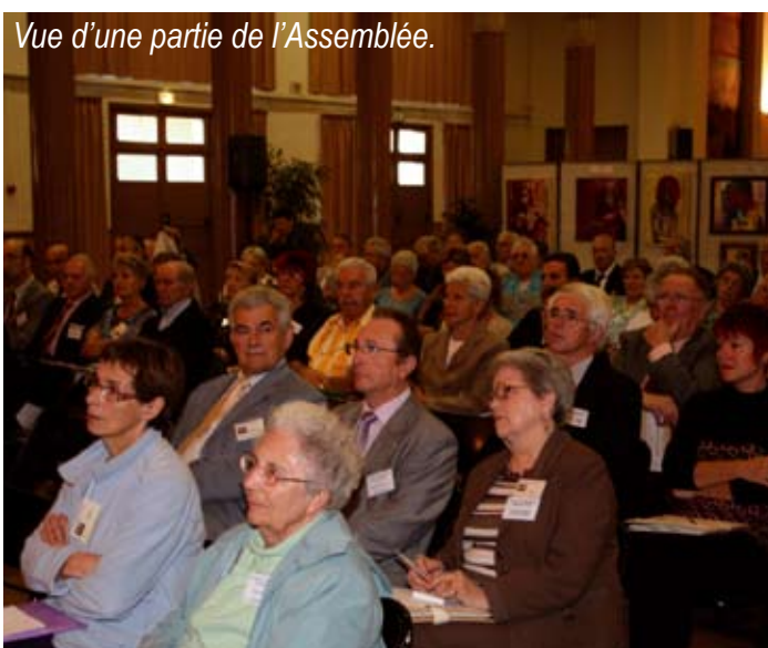
Vue d'une partie de l'Assemblée.

Ces différents rapports sont votés à l'unanimité.