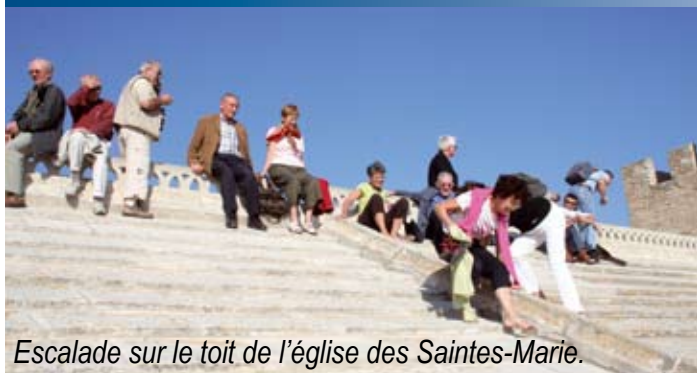
Escalade sur le toit de l'église des Saintes-Marie.

Réussite et succès pour notre 3 e Assemblée Générale depuis la relance de la Fédération des Villes et Conseils de Sages, tant sur le plan travail que sur le plan relationnel.