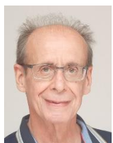
ESCALON Michel St Paul 3 Châteaux (26)